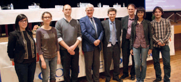
Le président du comité entouré des équipes de recherche que nous soutenons, présentes pour expliquer l'avancement de leurs travaux.

> Le site internet : il est alimenté plusieurs fois par semaine par des informations locales, des flashes d'actualité en cancérologie et des dossiers techniques ou scientifiques. En 2009, il recevait 1550 visiteurs par mois, actuellement c'est une moyenne de 4 900 visites chaque mois, soit un total de 59 000 visites dans l'année avec lecture de 108 000 pages. Le don financier reste rare par ce biais, mais on nous pose plusieurs fois par mois des questions par l'intermédiaire du site.